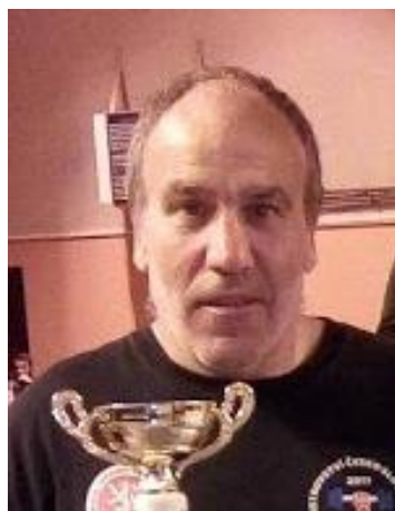
Le Président du Body Gym 77