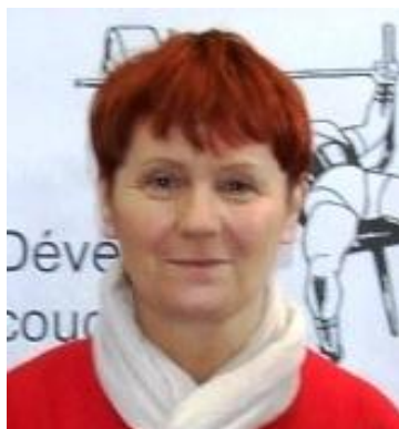
La Présidente du MHM